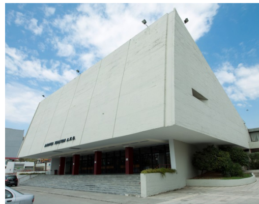
Ceremonial Hall: Aristotle University Campus