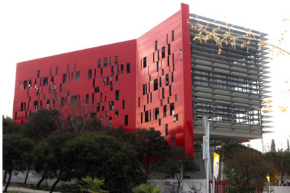
Center Dissemination of Research Results A.U.TH